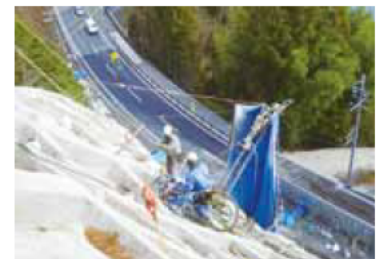
（「無足場アンカー工法」での施工現場）

有給休暇の取得を促進するために時間単位での取得を可能とし、さらに、お盆や年末年始は一斉に6日間の連続休暇を取れるようにしている。また、従業員の資格取得を奨励し、取得のための経費・時間面で支援するほか、合格者には報奨金の支給をしている。昨年度、役員兼総務部長の女性が、社会保険労務士の資格を取得し、在宅勤務規程、各種規則・規程を整備し、より良い職場環境づくりを目指して内容の充実を進めている。さらに、メンタルヘルスケアの体制も整え、ストレスチェックの実施等、社員の健康維持、増進に配慮している。