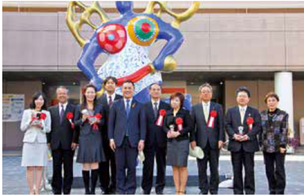
◎知事表彰式を実施【平成24年11月10日（土）】 （三重県男女共同参画センター「フレンテみえ」にて）

平成24年度の知事表彰企業は、平成24年度「男女がいそいそと働いている企業」認証制度に登録された68社の中から選考され、4社（ベストプラクティス賞2社、グッドプラクティス賞1社、選考委員会奨励賞1社）が選ばれました。