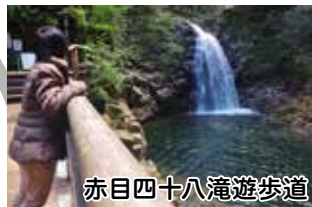
赤目四十八滝遊歩道