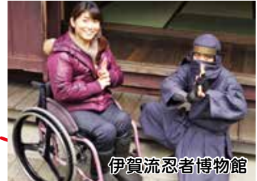
伊賀流忍者博物館