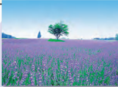
ラベンダー 4万株が咲き誇ると、まるで童話か映画のワンシーンのようなロマンティックな風景に。

みえ旅おもてなし施設のメナード青山リゾート。伊賀市青山高原にある、宿泊施設や温泉、エステなどの複合施設です。この時期は、広大なハーブガーデンがおすすめ。6月中旬まではカモミールフェスタ、6月下旬からはラベンダーフェスタがあり、ハーブの花や香りを楽しむことができます。詳しくは、メナード青山リゾート ☎059-554-1326まで。