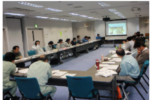
図 1. 技術検討会における検討の様子

その後、当該通知は廃止され、現在は平成 15 年 10 月 10 日付け健水第 1010001 号厚生勞