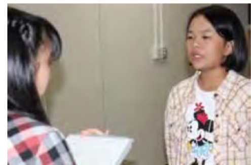
2人1組になって、直す ところを指摘し合いました