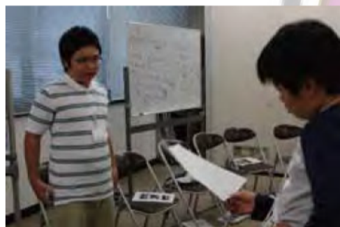
声の大きさや速さを確認して