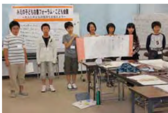
みんな堂々とできました