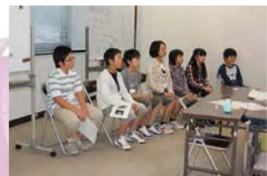
注意事項を真剣に聞きます