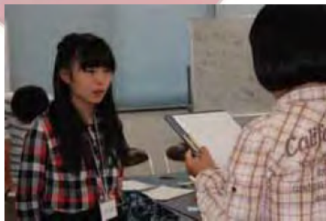
個人練習の開始です