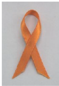
手作りオレンジリボン