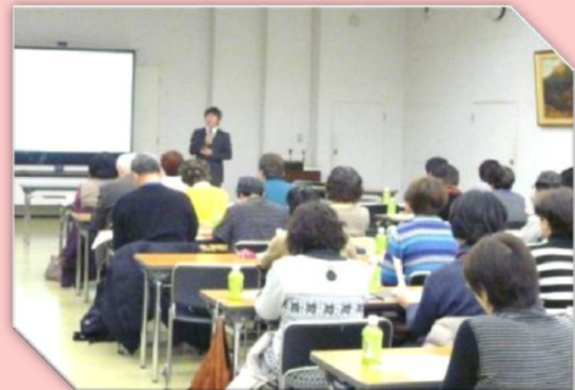
【子育てサポート講座】