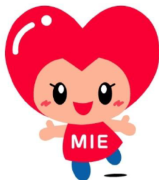
みっぷるファミリー