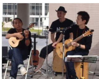
県産ヒノキ材で制作された楽器での演奏会。(ギター、ウクレレ、カホン)