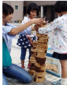
(上)丸太の円盤、どこまで積めるかな!!