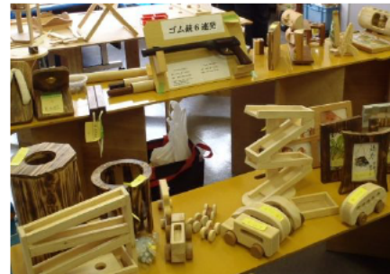
(左)尾鷲わっぱの展示販売や、(中、右)木製品の展示販売も行われました。(木を使うことが、森林を元気にします!)