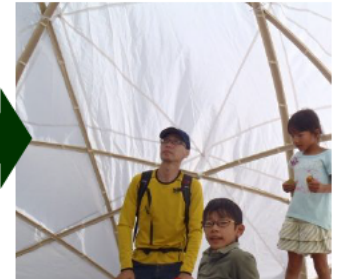
(左)会場内の竹を伐採して、(右)スタードームを作りました。