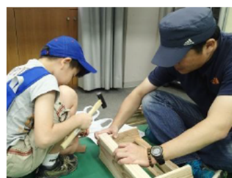
木製マガジンラック作り。たくさんご参加いただきました。