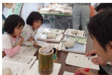
(左)狩猟免許模擬試験に挑戦。目指せ! 未来の狩りガール。