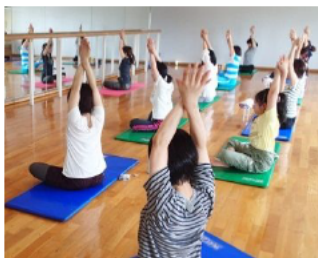
ひのきの香りに包まれながら、ヨガ教室を開催しました。