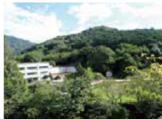
- 御浜町の発表 - 学校林整備事業について