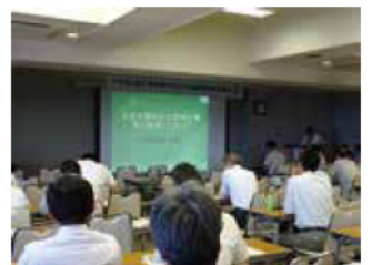
- 大台町の発表 - 水源地である森林の公有林化について