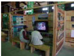
- 津市の発表 - WOOD JOB! 神去なあなあ日常記念館にて森林・木材利用促進フェアを実施

※発表内容の詳細は、下記ホームページをご覧ください。 http://www.pref.mie.lg.jp/SHINRIN/HP/mori/zei/seika/2015/