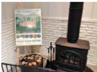
- 鳥羽市の発表 - 鳥羽マルシェ内に薪ストーブを設置等