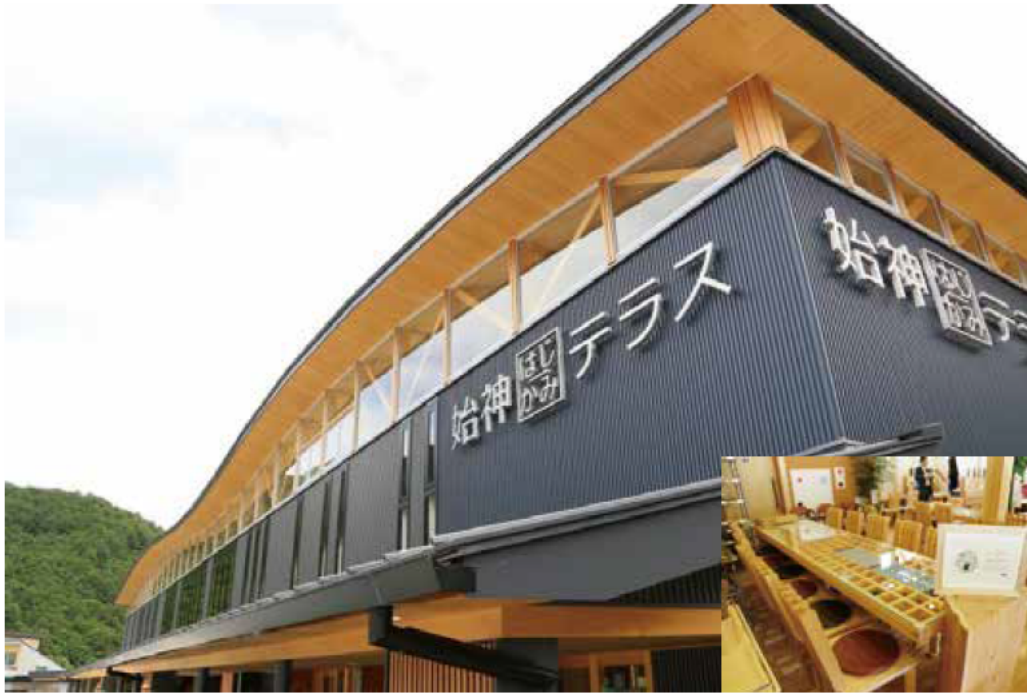
- 紀北町の発表 -暮らしに身近な森林づくりと森林環境教育活動、そして始神テラスにおける木の薫る空間づくり

三重県では、「災害に強い森林づくり」と「県民全体で森林を支える社会づくり」を進めるため、平成26年4月1日から「みえ森と緑の県民税」を導入し、土砂や流木を出さない森林づくりや森を育む人づくりなどの取り組みを実施しています。この税を活用した事業の成果を皆様にお知らせするため、平成26年度に実施した事業の成果発表会を平成27年7月31日に開催しました。