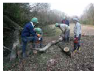
- 伊賀市の発表 - 地域住民の手で暮らしに身近な里山整備について等