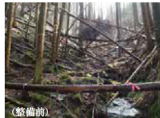
- 県の発表 - 土砂や流木を出さない森林づくりについて