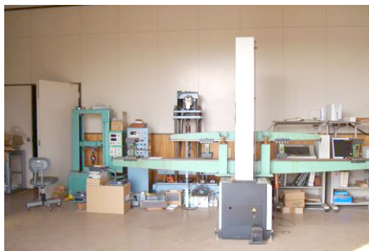
インストロン型万能試験機

材料一般試験室には恒温恒湿室(日本電化工機)を導入した。平成6年3月に薬剤注入缶(ヤスジマ、容量:0.33 m 3 )、環境試験装置(日本医科器械製作所、温度・湿度・照度・CO 2 制御)、オートクレーブ、クリーンベンチ、振とう培養機、色差計などが導入された。また、平成13年度に工業研究部から移設した燃焼試験機を設置している。