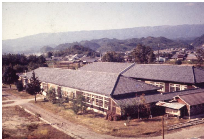
昭和 38 年開所時の庁舎（旧・白山中学布引校舎）