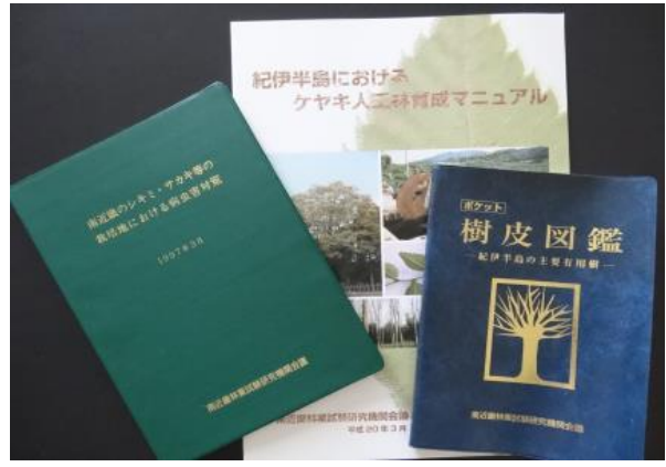
南近畿林業試験研究機関会議で発行した冊子