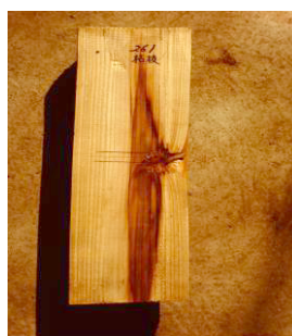
枝打ちにより発生した変色材

昭和 55 年に入ると、外材輸入が急増し、ヒノキ造林が増大するとともに、優良材生産が推奨された。また、環境緑化に対する気運が高まり、未利用樹種を緑化樹としての開発する課題が実施され、病虫害対策についても、併せて調査された。