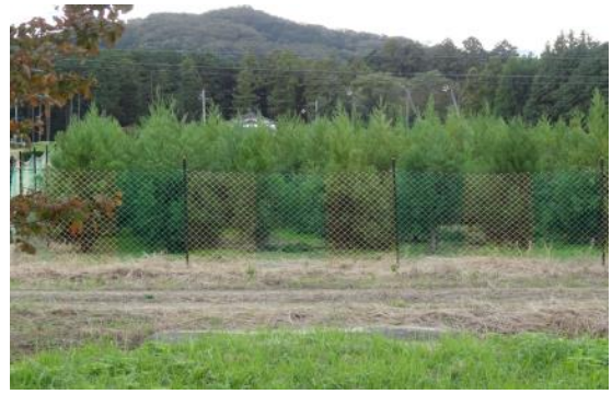
少花粉スギのミニチュア採種園