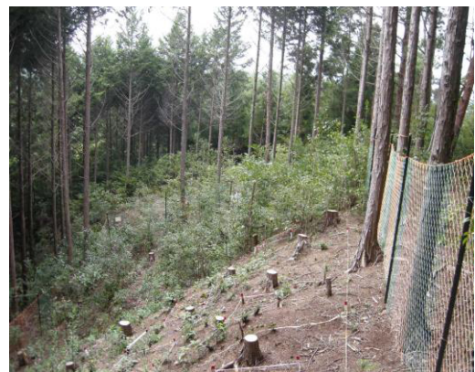
実習林の強度間伐試験地