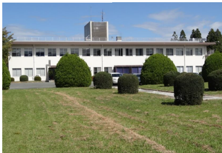
昭和 48 年に新築した本館