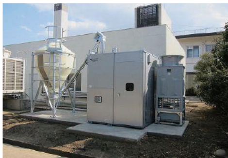
木質ペレット焚き冷暖房施設

本館内の図書資料室には、研究用の森林・林業・木材関係学会誌、雑誌や国公立林業・木材関係研究機関の定期刊行物、森林・林業関係図書を収蔵しており、希望者には閲覧も行っている。