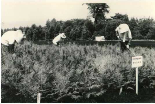
昭和 50 年度の次代検定林苗木育成作業