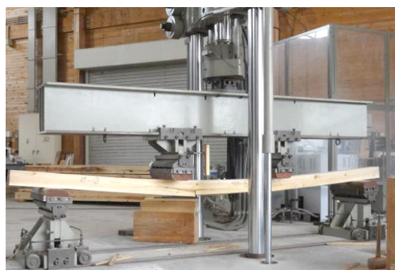
実大材強度試験機(最大荷重100トン)

棟内には、ホイスト(可動範囲23m、スパン長15m、吊下げ荷重最大2トン)、集塵機、材料性能試験に供する実大材強度試験機(島津製作所:最大荷重100トン、平成23年に計測部を改修)、パネルせん断試験機(島津製作所:最大10トン、ストローク200mm)。切削及び集成加工用の移動式丸鋸製材機、リップソー、ジャンピングカットソー、軸傾斜万能丸鋸盤、手押しカンナ盤、自動一面カンナ盤、超仕上げカンナ盤、スライサー、フィンガージョインター、ルーター、コールドプレス、ホットプレス、糊付け機などが順次導入された。