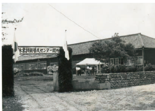
林業技術普及センター開所式(昭和 38 年 12 月)

昭和 38 年 4 月に木造の旧白山中学布引校舎を改装した林業普及センターが、林業試験研究機関としては全国で 43 番目に開設された。当時は交通事情が悪く、研修生用の宿泊、給食施設も設けられた。場長ほか庶務係 2 名、研修室 5 名、研究室 3 名の 11 名（研究室長が研修室長を兼務）が配置された。研修室には 5 名の専門技術員が配置され、主に県や市町村及び森林組合等の職員を対象とした研修会を開催した。