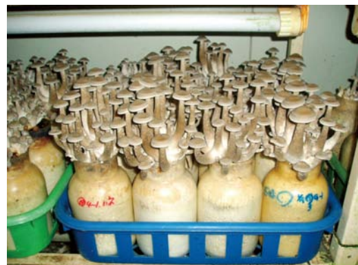
ハタケシメジのビン栽培