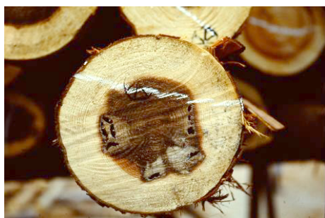
スギノアカネトラカミキリによる被害材

昭和 40 年半ばには全国的に松くい虫被害が拡大していた。三重県は近隣県に比べて被害の拡大が遅れていたものの、昭和 51 年から急増した。昭和 45 年頃からスギ・ヒノキ優良材生産に注目が集まり、枝打ちや間伐が奨励された。量から質が求められると、材内に発生する虫害や枝打ちによる変色発生が大きな問題になり、昭和 48 年からスギカミキリ、スギノアカネトラカミキリ被害の発生原因や被害程度の把握、防除方法に取り組んだ。昭和 50 年からは枝打ちによる変色発生原因についても究明された。