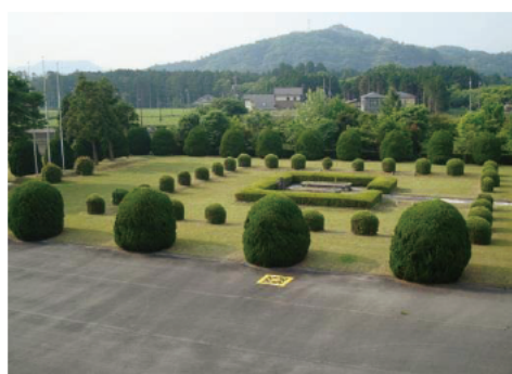
本館前の芝生広場

この 50 年の間、世の中は高度経済成長からバブル経済の崩壊、デフレ経済時代へと目まぐるしく変化しました。森林・林業に期待される役割も時代とともに、木材供給力の向上から災害防止や地球温暖化防止など森林の多面的機能の重視へと変化してきました。林業研究所の研究課題も短伐期施業のための林地肥培や早生樹の現地適応、マツクイムシなど病虫害対策から優良材生産、人工乾燥や圧密などの木材加工を経て、長伐期化、中大径材利用やシカ害対策へと移り変わってきています。