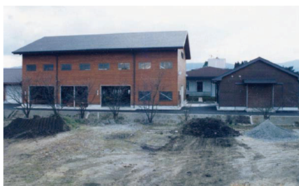
建築当時の木材加工棟（左）と木材試験棟（右）

一方、本県は全国に先駆けて人工林の伐採期を迎えようとしていたことから、スギ一般材の需要拡大を図るため、木材加工技術及び新用途の研究開発が緊急課題となった。このため、平成元年度から5カ年計画で木材加工関係試験研究施設の整備に取りかかり、平成元年度から木材乾燥棟、木材試験棟、木材加工棟、資材倉庫を順次建設し、本格的な木材加工研究施設が整った。これにより、県産材のブランド化を推進するため、製材の人工乾燥技術、県産スギ・ヒノキ材の強度性能評価や針葉樹中径材を利用した住宅用高機能部材の開発などの研究を始めた。