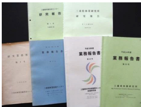
研究報告と業務報告書

平成12年1月発行の第158号から、林業研究部情報「森のたより」と名称変更し、年2回発行となった。平成20年4月には科学技術振興センターが廃止され、組織名称が三重県林業研究所と変更されたため、誌名を「林業研究所だより」とし、カラー刷りの第1号(通号173号)が平成18年6月に発行された。以後、年2回ずつ発行している。なお、林業研究所だよりは県及び市町の林業部門、林業・木材関係団体、全国の林業試験研究機関等へ配布するとともに、三重県林業研究所のHPにも掲載している。