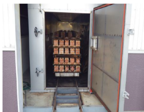
スギ正角材の高周波乾燥試験