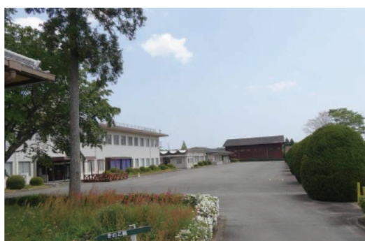
左から本館、研修館、交流館、木材加工棟

しかし、この間一貫として、地域の林業・木材関係者の方々から寄せられた要望や本県の林業行政における課題に基づき、地域に密着した研究・技術開発を続けることができたのも、関係する皆様方からの温かいご支援、ご協力をいただいた賜物と心から感謝申し上げる次第です。今後とも、研究の成果を地域に移転・普及することにより、本県の林業振興に対して技術面からの貢献を果たしていきたいと考えております。