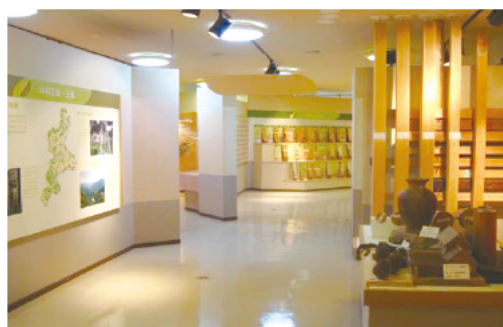
交流館の林業展示