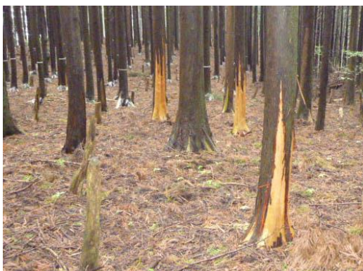
ニホンジカによる造林木の剥皮害

平成7年に整備された「きのこ栽培試験棟」を使って、ハタケシメジの栽培マニュアルを作成し、三重の新しいきのことして商業生産が開始された「ハタケシメジ」の安定生産技術の支援研究が始められた。現在は、輸出品が多いアラゲキクラゲのほか、野外でしか発生がみられないオオイチョウタケの施設栽培に関する研究が行われている。