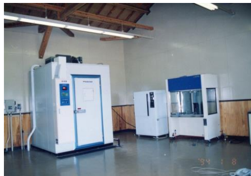
環境試験装置、クリーンベンチ