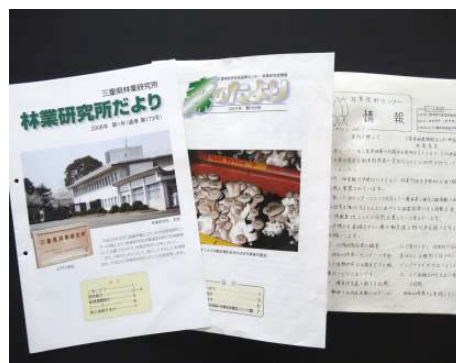
情報、森のたより、研究所だより