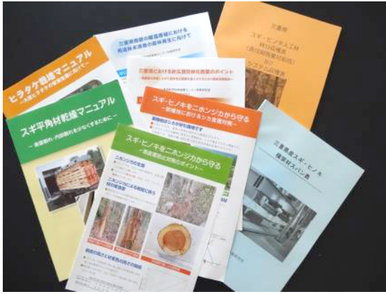
印刷したリーフレット