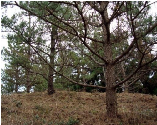
マツノザイセンチュウ抵抗性クロマツ採種圃園

平成 21 年度以降、スギ種子の需要がなくなったことから、川口採種圃園のスギ採種圃園 3.45ha を全廃し、ヒノキの低密度植栽試験地を設定した。