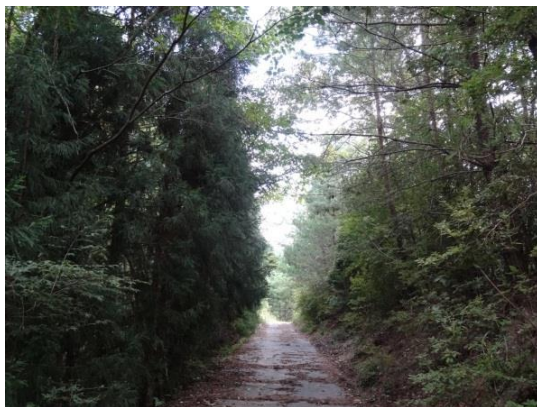
実習林の管理道路と外国マツ

近年は、植栽後に間伐されてないスギ、ヒノキ林での強度間伐による植生回復や降雨による流量、土砂流出量を調査するための試験林が設置され、継続調査が実施されている。