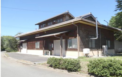
きのこ栽培試験棟