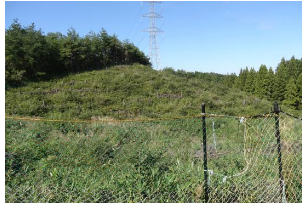
ヒノキ低密度植栽試験地