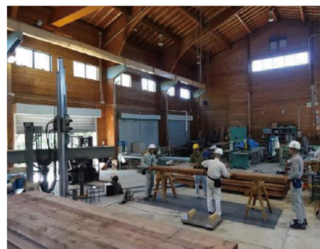
県内産スギ大断面集成材を使用