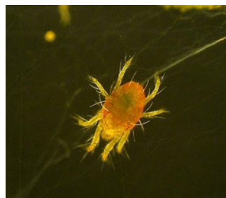
図2 カンザワハダニ