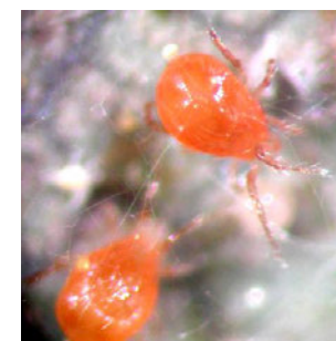
図3 チリカブリダニ

ボトル入りで販売されています。より効果的に導入できるように、普及センターや販売所と相談してください。本県ではイチゴ以外の用途も含めて下表のように多数使われており、イチゴ農家にもたのもしい助っ人となってきています。