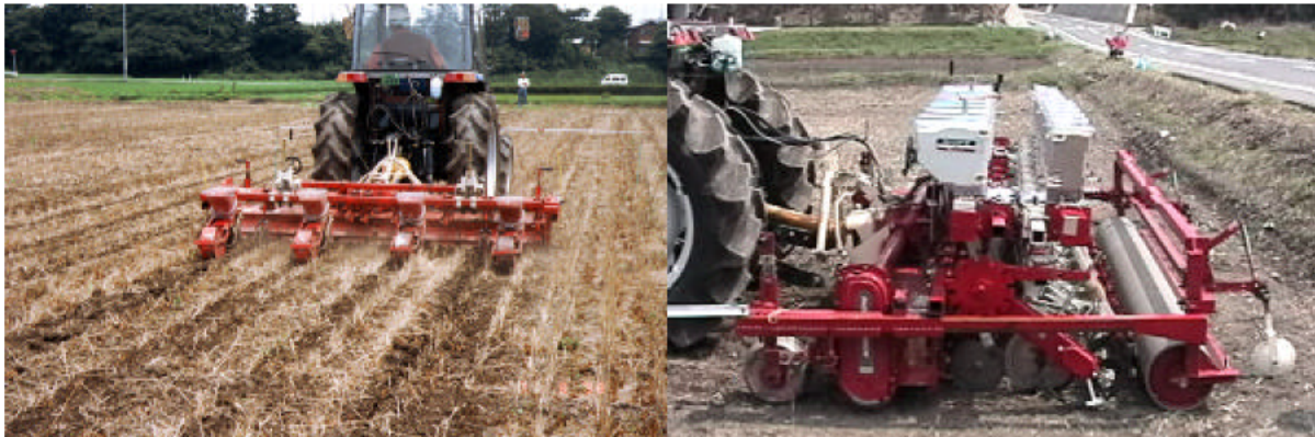
図1 稲麦用削耕不耕起播種機の大豆への適用（左：大豆播種、右：稲麦播種時）