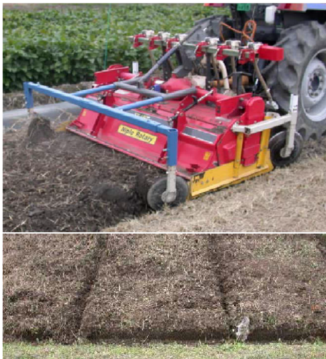
図1 播種前小明渠浅耕処理(上)と外周明渠への連結(下)