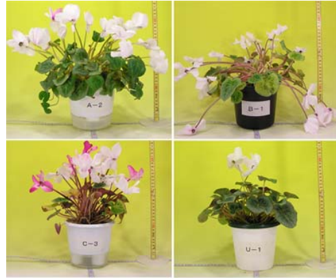
写真1 シクラメン観賞終了時点の例 注: 観賞終了はモニター個々の判断による。枯れ上がってきたものの他に、花が無くなったもの、花はあるが形が崩れてきたものなどの終了パターンがある。