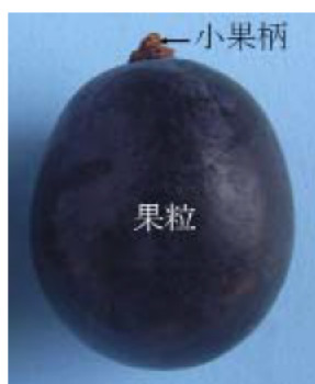
図1 果粒の切り離し方