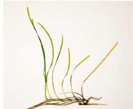
図3 海から採取したコアマモと組織培養により誘導された増殖体様種苗 (右)