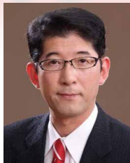
高鳥 修一氏 内閣府副大臣 (国土強靱化担当)