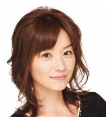
<司会> 武藤 乃子 フリーアナウンサー