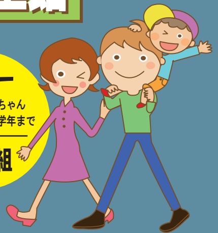
協力:パパスマイル四日市

パパとファミリー 大募集 ※お子さまは赤ちゃん から小学校低学年まで 参加無料 親子20組