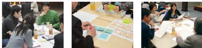
昨年のフューチャーセッションの様子