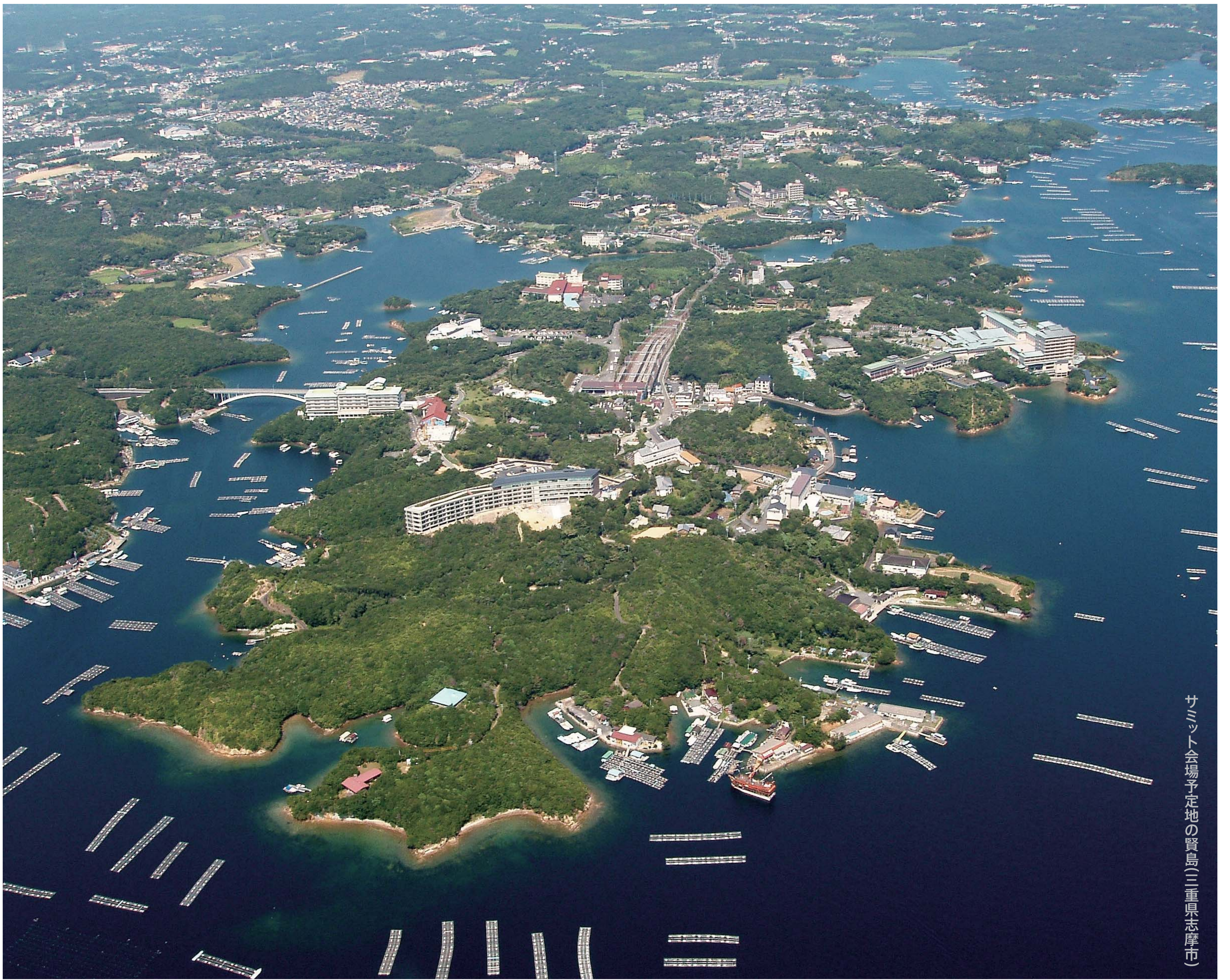
サミット会場予定地の賢島(三重県志摩市)