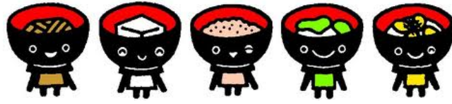
わんこきょうだい