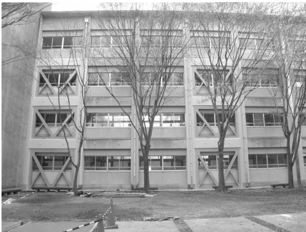
耐震化工事が行われた松阪工業高校の校舎