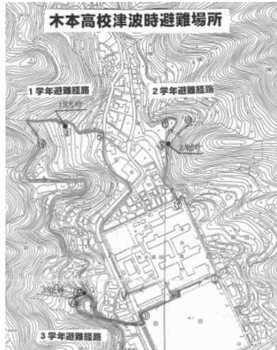
木本高校の避難経路（学年で経路と避難場所を分けている）