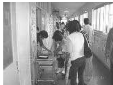
小学校における引き渡し訓練の様子