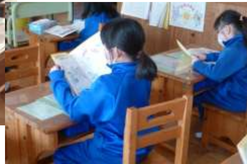
防災学習（南伊勢町立南島東小学校）