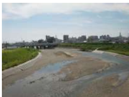
三滝川広域河川改修（四日市市）