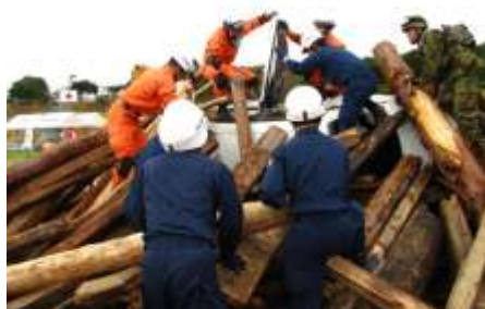
総合防災訓練（土砂埋没車両からの検索・救助活動）