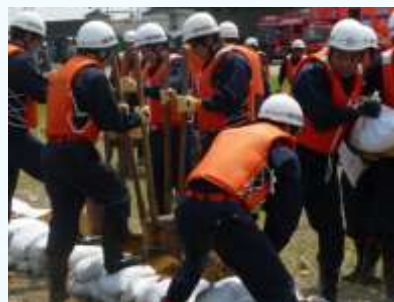
土嚢積み（松阪市消防団）

また、女性消防団員が各家庭への防火訪問や幼児、児童への防火教育、広報活動など、多岐にわたって活躍しているほか、大学生、専門学校生も年々増加し、活発に活動しています。