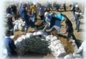
海蔵地区防災会（四日市市）