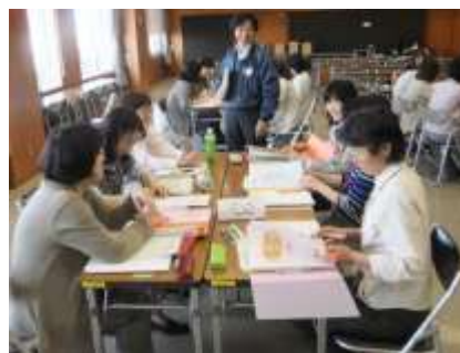
こころのケア活動研修会