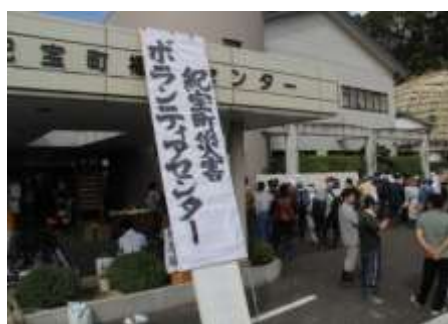
紀伊半島大水害（紀宝町災害ボランティアセンター）