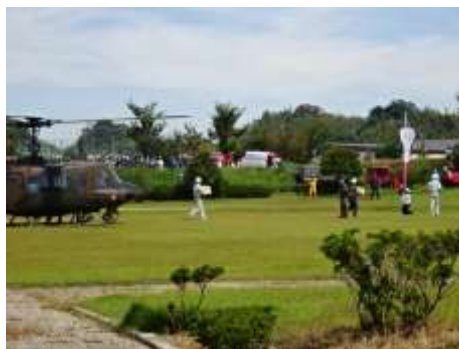
桑員地域広域避難訓練 支援物資搬送訓練（伊賀広域防災拠点→多度アイリスパーク）