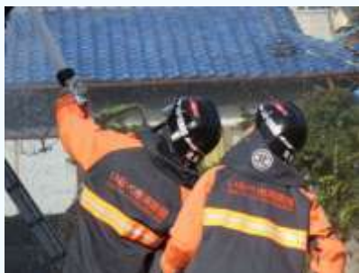
消火活動（いなべ市消防団）

地域によって、活動内容も異なりますが、火災が起きた際は消防職員と協力して消火活動を行ったり、近隣住民の安全確保、周辺の交通整理等を行います。また、風水害時には、河川等の警戒や土嚢積み、自主防災組織と協力して避難支援を行うなど、さまざまな災害対応を行っています。