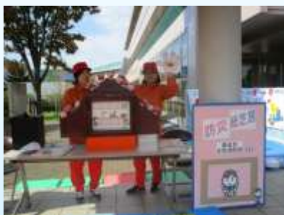
防災紙芝居（桑名市女性消防団）

また、女性消防団員が各家庭への防火訪問や幼児、児童への防火教育、広報活動など、多岐にわたって活躍しているほか、大学生、専門学校生も年々増加し、活発に活動しています。