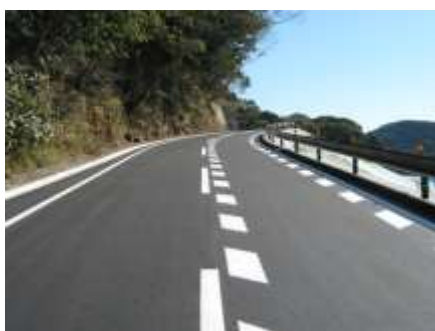
国道311号拡幅（熊野市甫母）