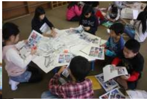
防災学習（津市立高茶屋小学校）