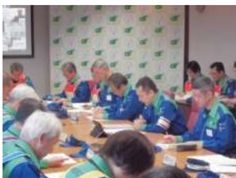
図上訓練（本部員会議）