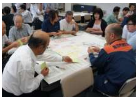
災害時の帰宅困難者対策ワークショップ（観光地の防災対策）