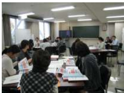
災害時保健師活動訓練