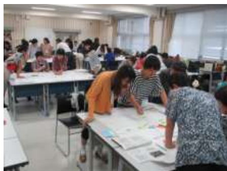
みえ防災コーディネーター育成講座（女性限定）