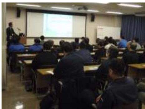
出前トーク（防災講話）