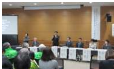
防災セミナー「災害時の要援護者対策について考える」（伊勢庁舎）