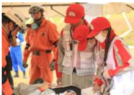
総合防災訓練（緊急仮設診療所における医療救護活動）