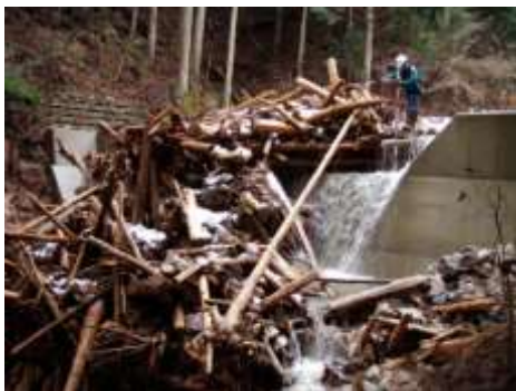
治山施設に異常堆積した流木の除去（亀山市）