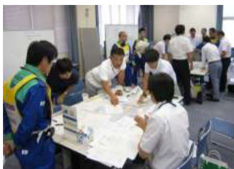
市町防災担当職員を対象とした防災講座（初動期）