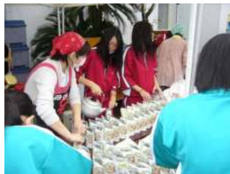
総合防災訓練（避難所開設・運営訓練） （県立南伊勢高等学校生徒による炊き出し協力活動）