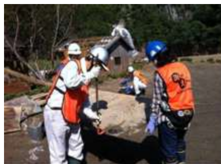
紀伊半島大水害（作業を行うボランティア）