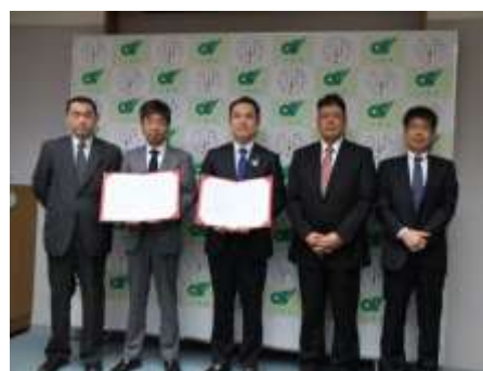
災害時における帰宅困難者に対する支援に関する協定書締結式