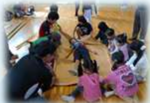
南が丘地区自主防災協議会（津市）