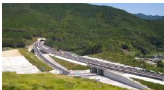
ミッシングリンクの解消（熊野尾鷲道路 新鹿中山地区）