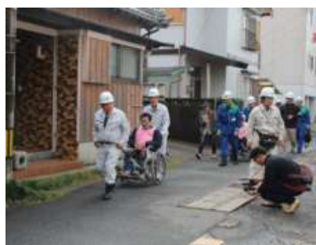
総合防災訓練（災害時要援護者避難活動）