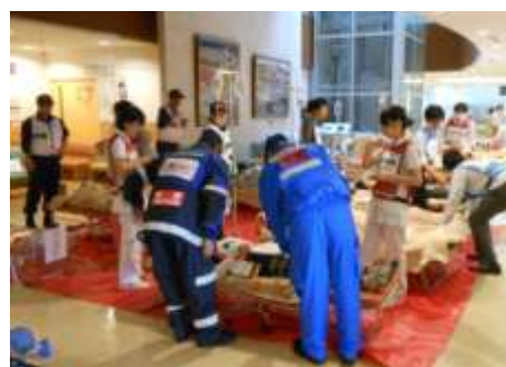
総合防災訓練（災害拠点病院（志摩病院）運営活動 及びDMATによる運営支援活動）