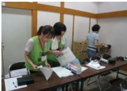
紀伊半島大水害（避難所での健康相談）