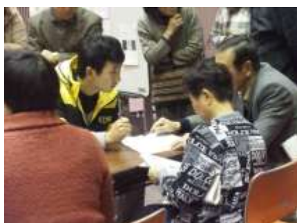
仮想避難所での外国人住民対応