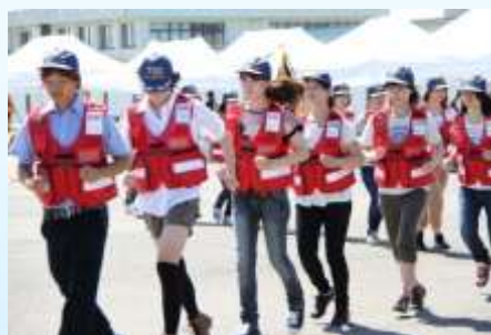
訓練（津市消防団学生機能別団員）