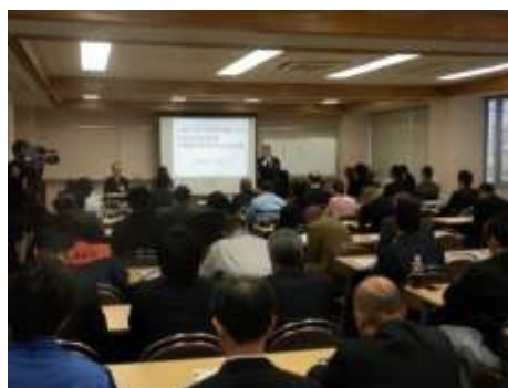
三重県市町等防災対策会議