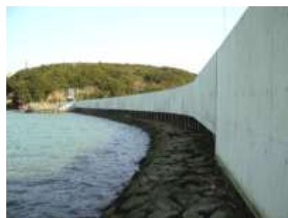
農地海岸の高潮対策（志摩市）