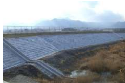
農業用ため池の洪水防止対策（津市）