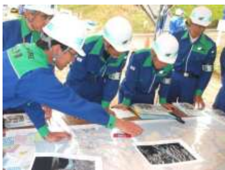
総合防災訓練（人工衛星画像を活用した孤立地域の確定活動）