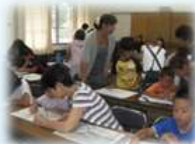
古和浦親子防災の会（南伊勢町）