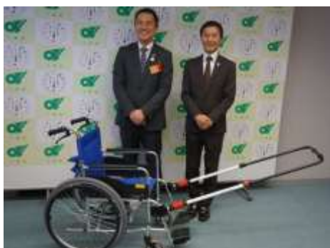
簡易装着型けん引式車いす補助装置寄贈式