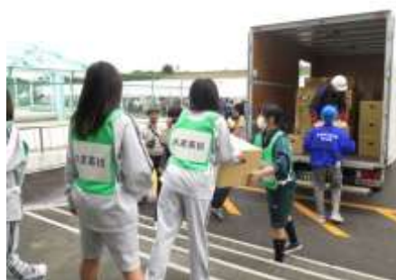
総合防災訓練（地域住民及び若い力による物資受取活動）