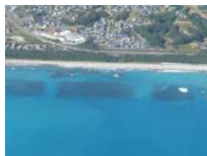
人工リーフの設置（紀宝町）