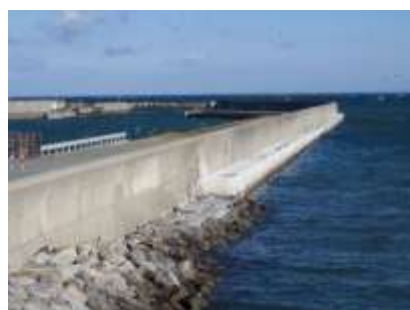
漁港の防波堤の整備による高潮対策（明和町）