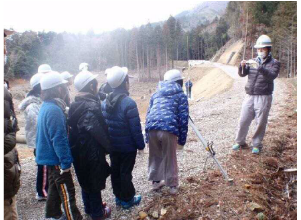
測量機器で高さを模擬計測