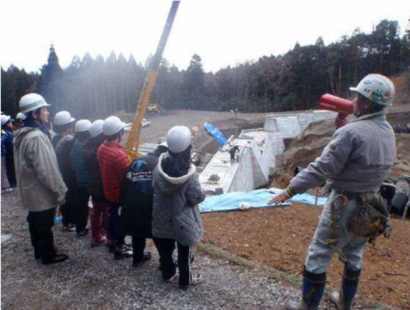
砂防えん堤のつくり方を学習