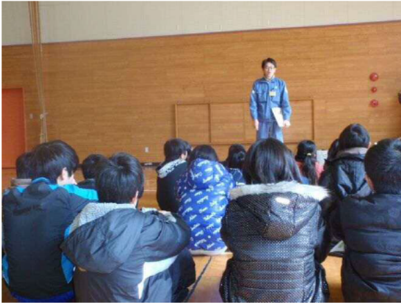
砂防、土石流について学習