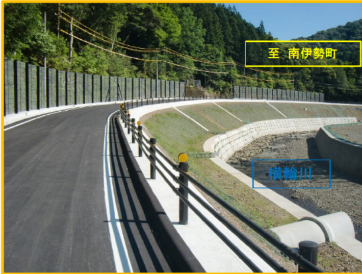
全景(伊勢市側より)