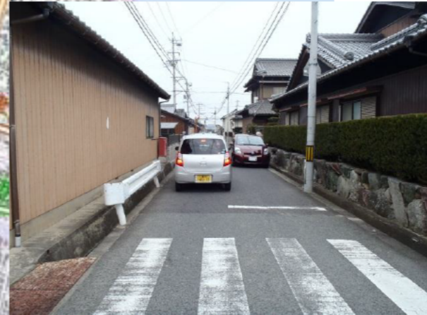
②整備後 雲出野田バイパス