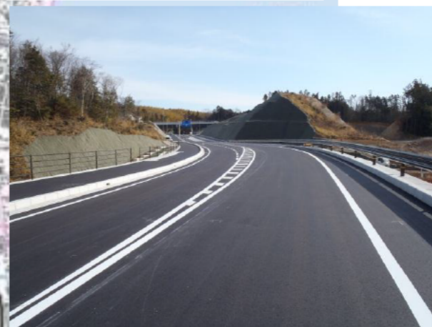
③整備後 五軒町バイパス