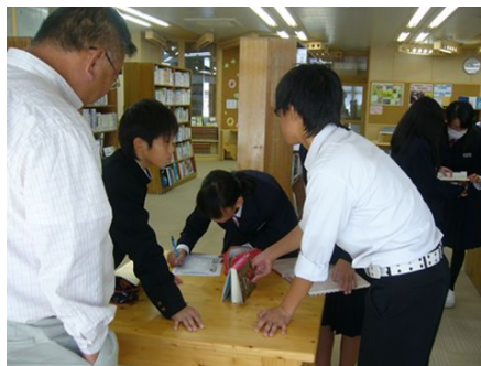
(紀北町立紀北中学校の様子)

事業終了後は、それぞれの市町において、学校司書の配置等独自の取組が進められることが望まれます。