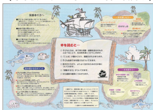
(小学校 1 年生の子どもを持つ親向け)