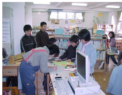
(多気町立勢和小学校図書館の様子)

また、町立図書館司書との合同研修の実施など、資質向上に積極的に取り組んでいます。