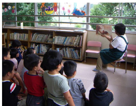
(津市立村主小学校図書館の様子)

また、学校図書館司書による読み聞かせやブックトーク、公立図書館の団体貸出による図書館資料の有効活用等を行いながら、読書活動の充実を図っており、利用者数や貸出冊数が増えるなどの効果が出ています。