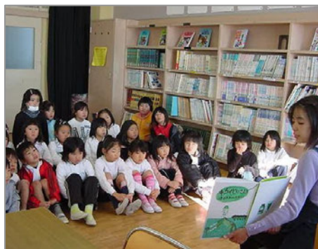
(伊勢市立神社小学校図書館の様子)

このボランティア活動を希望する人は、市教育委員会に登録された後、学校からの要請に応じて派遣されます。