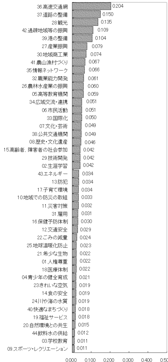
図 重要度の標準偏差(地域)