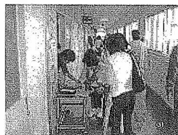
小学校における引き渡し訓練の様子