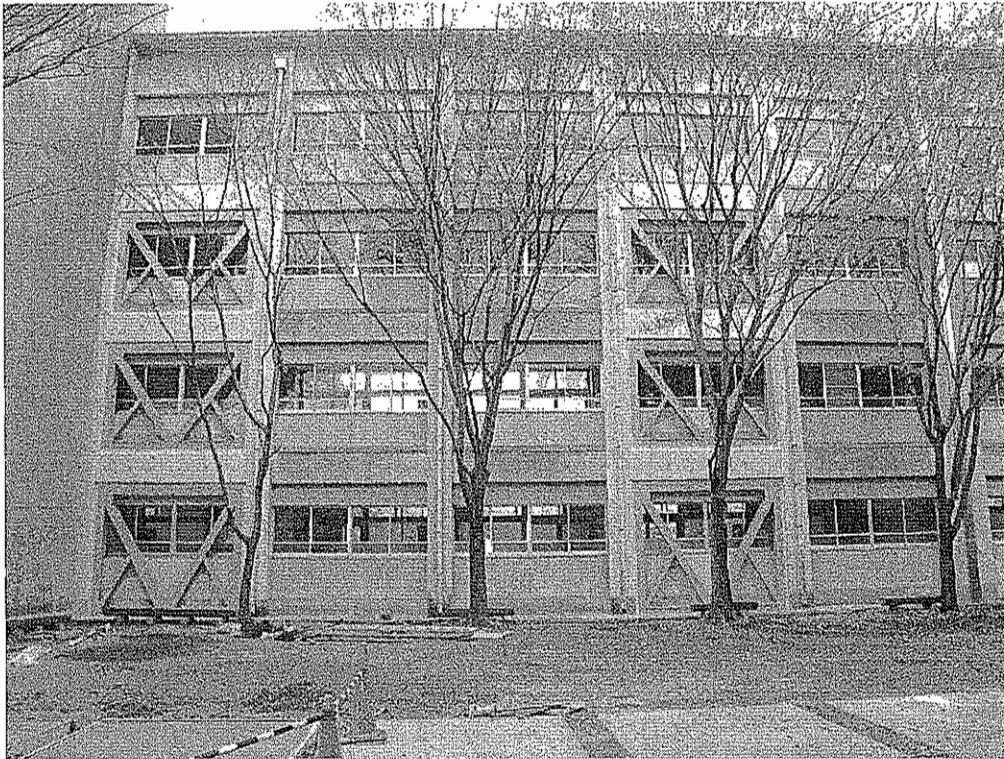
耐震化工事が行われた松阪工業高校の校舎