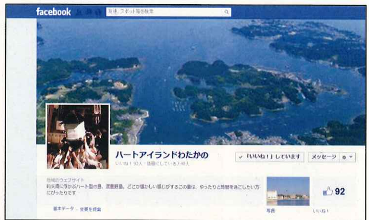
《住民が立ち上げたフェイスブックページ》