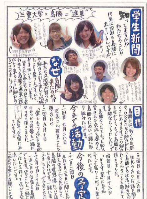
《紀北町島勝浦：学生新聞の発行》