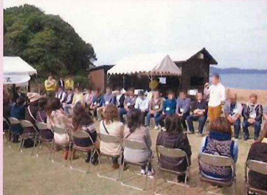
《開会式：一人ずつ自己紹介》