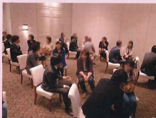
《1対1のトークタイム》