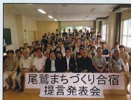
《まちづくり合宿最終日に 集合写真を撮影》