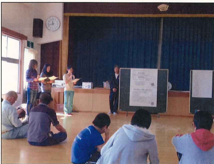
《御浜町神木：住民アンケートの結果発表》

→地域住民の日常生活上の課題を把握するための住民ヒアリングを実施。多くの住民の参加を促すため、住民アンケートの実施や学生新聞の発行など、地域住民の主体的な取組につながる活動を進めている。