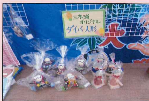
《婦人部の方が手作りで用意した商品》