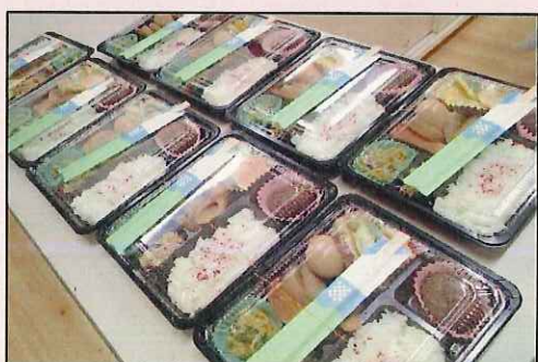
《「笑顔食堂」で販売した 手作り弁当》