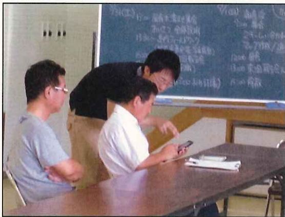
《7/28 大学生によるフェイスブック講習会》

→四日市大学の学生の提案（SNSを活用した情報発信）を受け、住民自らがフェイスブックページを立ち上げ、島の日常風景等を住民目線で情報発信している。