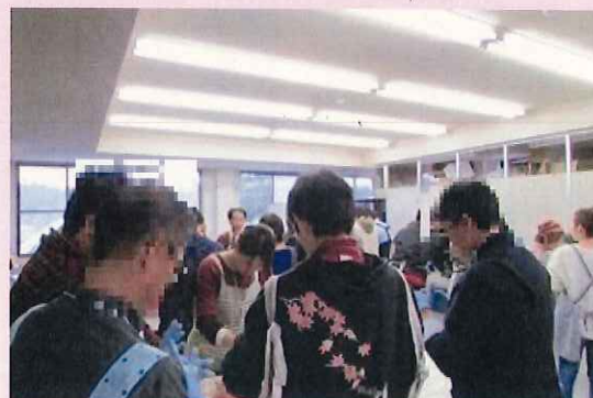
《共同作業（ソーセージづくり） を通じて交流》