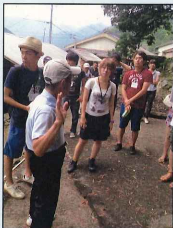
《地域住民の案内で フィールドワークを実施》