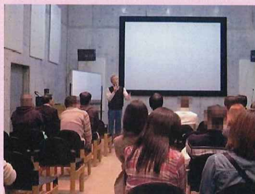
《コーディネータから カップリングの発表》