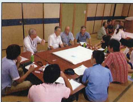
《ワークショップで 地域の方と意見交換》