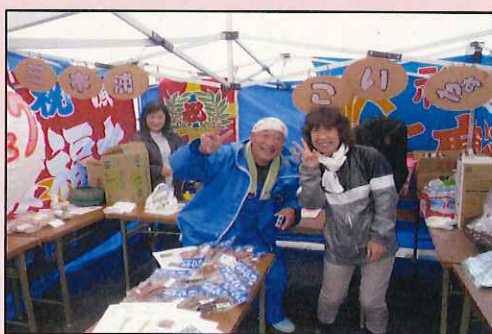
《住民自ら地域の特産物を販売》