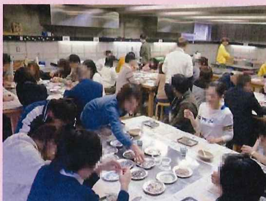
《共同作業（ジェルキャンドル作り） を通じて交流》