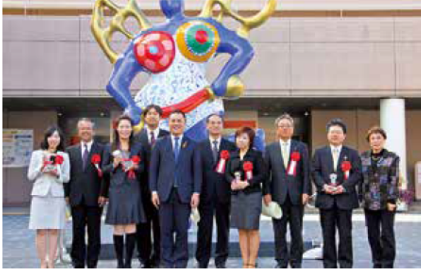
◎知事表彰式を実施【平成24年11月10日（土）】 （三重県男女共同参画センター「フレンテみえ」にて）

平成24年度の知事表彰企業は、平成24年度「男女がいそいそと働いている企業」認証制度に登録された68社の中から選考され、4社（ベストプラクティス賞2社、グッドプラクティス賞1社、選考委員会奨励賞1社）が選ばれました。