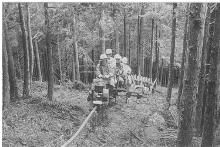
モノレール稼動状況（大内山村）