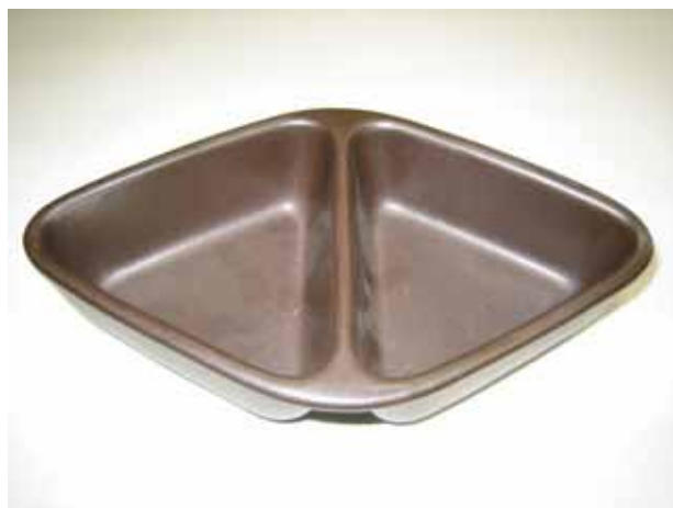
図 1 複雑形状のペタライト系陶土製品

そこで、市販されているペタライト系陶土を使用して製品化されている中で最も複雑な形状である図 1 の製品の熱衝撃試験を実施した。熱衝撃試験は JIS S 2400 : 2000 に規定されている直火用試験温度差 350 など水中急冷法にて実施した。