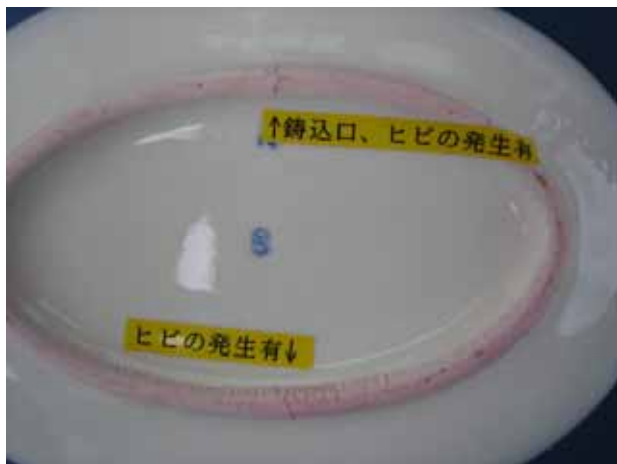
図2 楕円グラタン（鑄込み口高台 焼成温度SK8）の熱衝撃試験結果の写真

試験結果から、鑄込み口位置や鑄込み圧力の差は耐熱衝撃性に大きくは影響せず、意匠設計の中で高台を設定せずベタ底に設計する方が耐熱衝撃性を維持・改善できることがわかった。