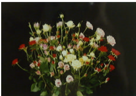
写真 消費が伸びているスプレーバラ