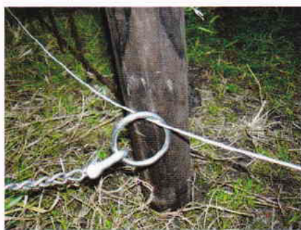
鋼線とリングの連結状況

イヌが農地の周囲をグルグル走り回ってサルを追い払います。グルグル走り回れるポイントは、円状につないだ鋼線を土の上に置くだけなので、杭に連結しないからです。