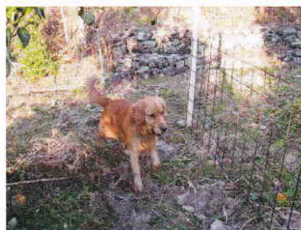
イヌが周回する様

・杭は鉄のパイプなどでも代用できます。また、ワイヤーメッシュもネットなどを使えばより安価です。