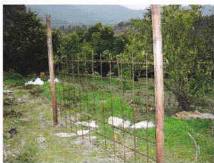
杭とワイヤーメッシュの設置状況

・鋼線にリングを通して、杭を通過できるようにします。草などが巻きつかないように管理します。