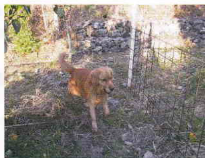
イヌが周回する様子

・鋼線にリングを通して、杭を通過できるようにします。草などが巻きつかないように管理します。