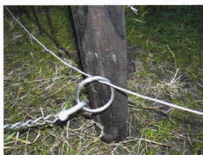
鋼線とリングの連結状況

イヌが農地の周囲をグルグル走り回ってサルを追い払います。グルグル走り回れるポイントは、円状につないだ鋼線を土の上に置くだけなので、杭に連結しないからです。