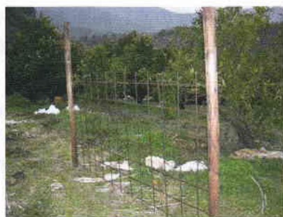
杭とワイヤーメッシュの設置状況