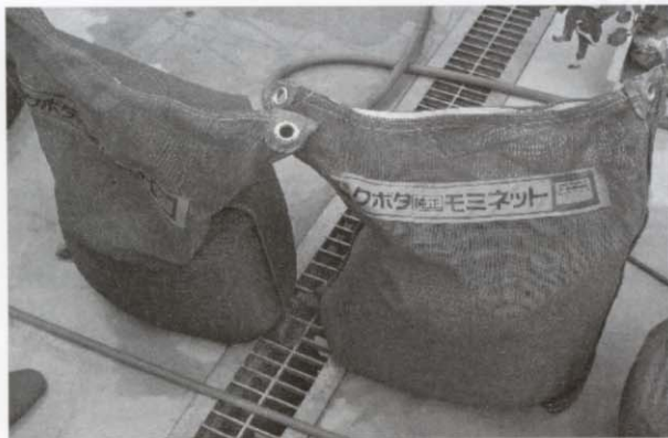
写真2 網袋に入れた種もみ（1袋当たり20kg入れる）