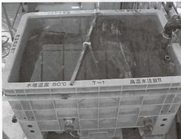
写真3 殺菌水槽に80kgの種もみを入れた状態

60kg処理の場合は予浸なしの区を設けた。温度の測定・記録はデータロガー（横河、DATA ACQUISITION UNIT DA100）により行った。種もみの温度測定において、センサーを種もみ袋の中心部に挿入した。