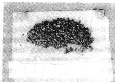
写真2. みかんジュース粕

なお、20%添加した場合には残食がみられたので添加量は10%以内が良く、粉碎すれば、更に利用価値は向上するものと考えられる。