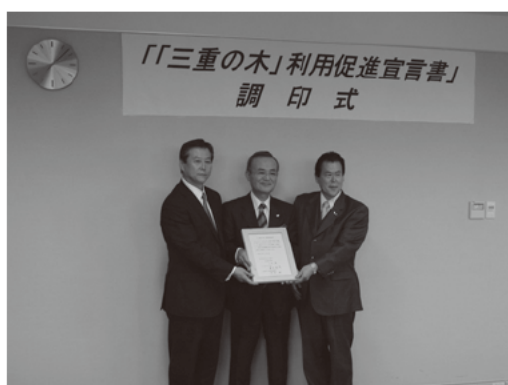
「三重の木」利用促進宣言書調印式

また、環境保全、地球温暖化の防止、地元林業の振興などを目的として「三重県木材CO 2 固定量認証制度」を創設しました。この制度は、三重県産材を使用した住宅の建築、店舗・事業所の内外装や備品の整備及び木材製品を購入した場合、そのCO 2 固定量を認証するものです。認証制度は「企業・団体認証」と「個人認証」に分けて行い、「企業・団体認証」は平成22年3月1日から、「個人認証」は平成22年4月1日から申請の受付を行っています。