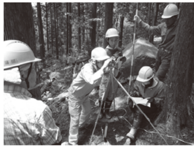
【フォトコンテスト2009】 森林とのふれあい部門 最優秀作品

また、Mie子どもエコフェアなど各種イベントへの出展や、木づかい達人による木づかい教室など、木づかいの技の実演会を開催し、森林や木とかわりを持ちながら、生活されている方々の営みにもふれ、森林や木の文化を感じていただける機会づくりにも取り組んでいます。