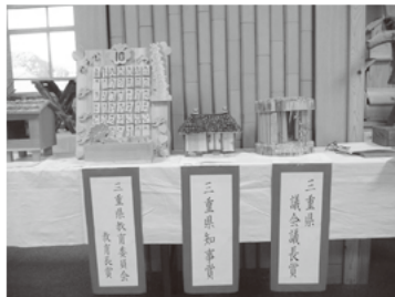
木工教室&木工作品コンテスト入賞作品