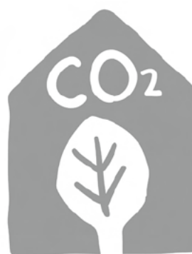
「三重県木材CO 2 固定量認証マーク」