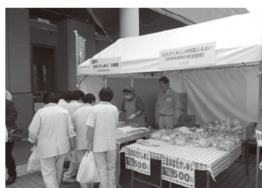
「はたけしめじ」の料理ふるまい（試食）と販売