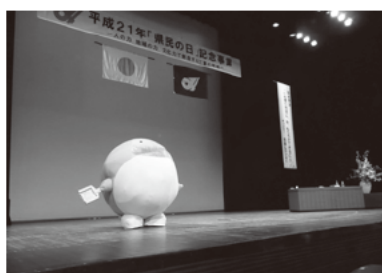
“動く”ゼロ吉初登場

「県民の日」記念事業には、県内各会場あわせて約1,300人の皆さんにご参加いただきました。