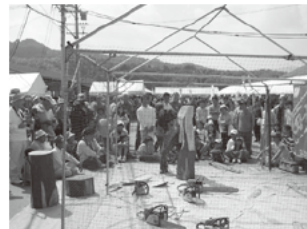
チェンソーアート実演会