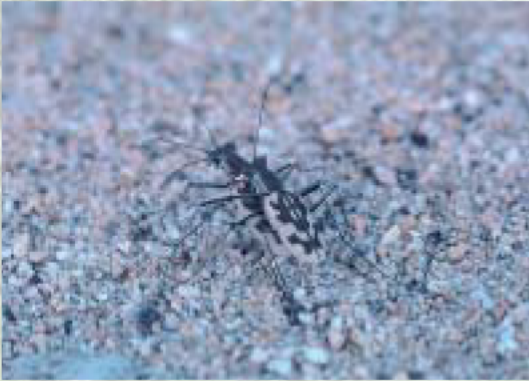
カワラハンミョウ

体長約20mm。北海道南西部から九州北部に分布し、川原や海浜などの乾燥した砂地にすんでいる昆虫です。成虫は夏にみられ、小昆虫やクモなどを捕食します。人的活動による生息地の消滅などにより、減少しました。