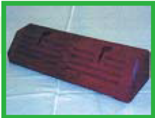
再生プラスチックの車止め