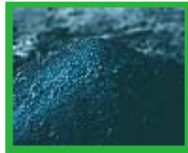
建設汚泥使用の改良土