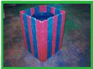
再生プラスチックのゴミ箱