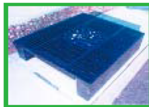
再生プラスチック嵩上げ材使用 ダクタイルグレーチング