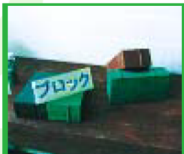
再生プラスチックのレンガブロック