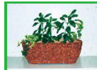
木くず使用のプランター・小物雑貨