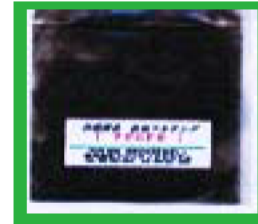
樹皮使用の泥土固化材