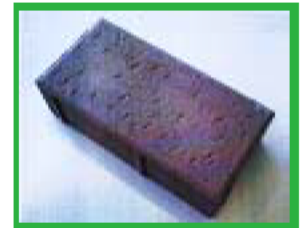
碎石廃土等使用の インターロッキングブロック