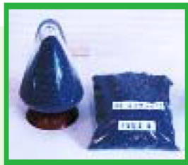
焙焼灰使用のサンドクッション材