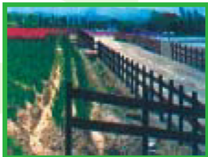
再生プラスチックの擬木