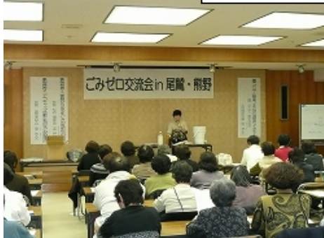
H21尾鷲熊野地域ごみゼロ推進交流会の様子