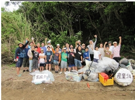
志摩自然学校の英虞湾清掃