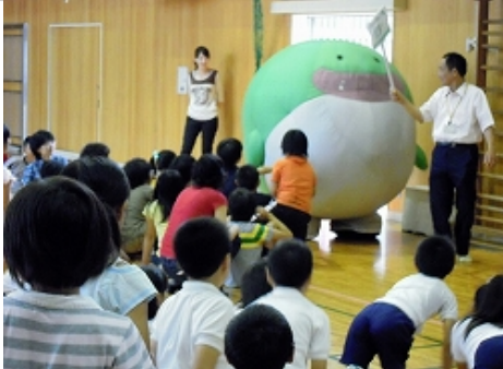
伊勢市立明倫小学校の環境教育集会