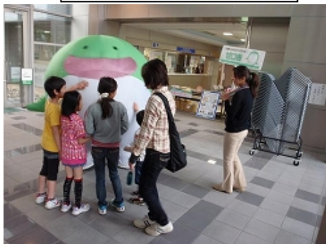
春のキッズエコフェア