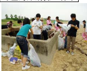
町屋海岸清掃の様子