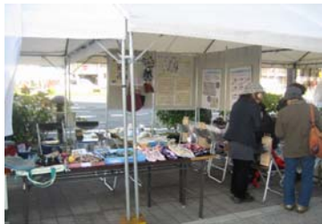
津市農林水産祭りの様子