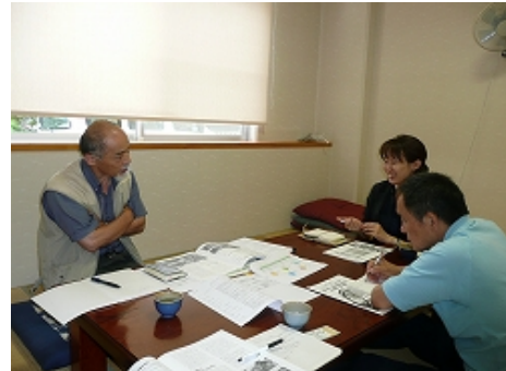
三重スローライフ協会のレポート取材