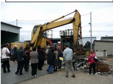
H21津地域ごみゼロ推進交流会