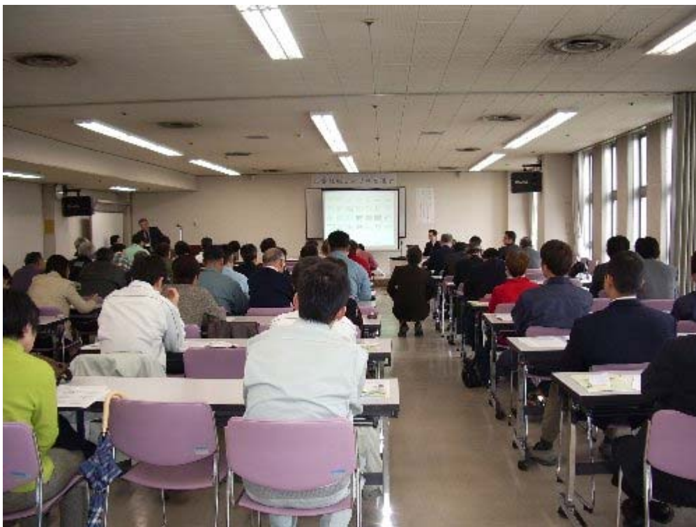
パネルディスカッション風景