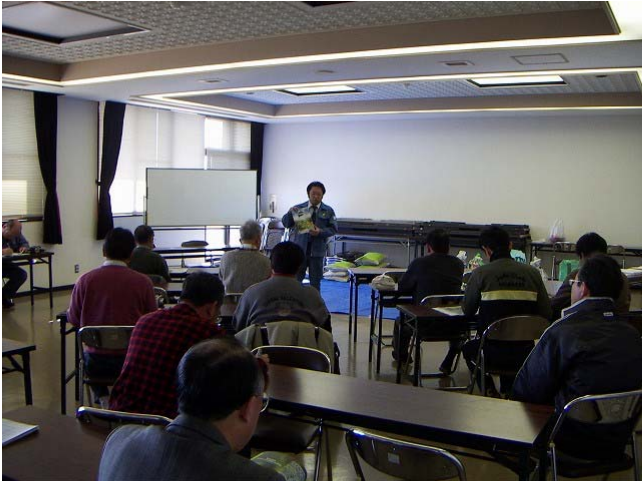
生ごみ堆肥化講義