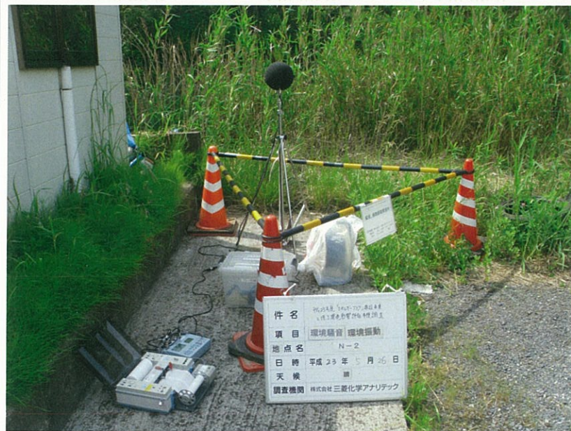
No. 5 騒音・振動