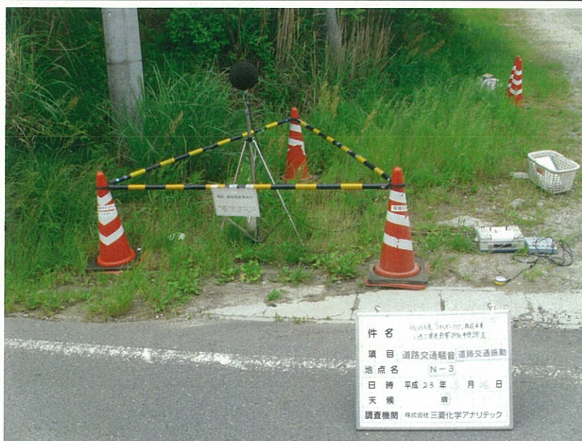
No. 6 騒音・振動