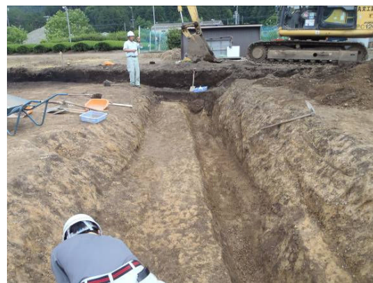
室町時代の道の跡です。排水用の側溝を設けています。路面は踏み固められていました。

重機を用いて表土を取り除いたあと、土の表面を削ってきれいになると、鎌倉～室町時代の柱跡や小さな道の跡などが見つかりました。