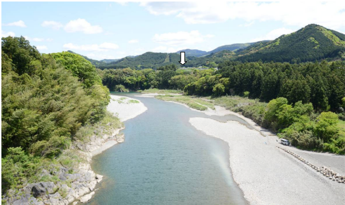
七保大橋の上から遺跡を望む（西から）

野添大辻遺跡は日本一の清流、宮川の南岸に位置する縄文時代・中世（鎌倉～室町時代）の集落跡です。昨年度の調査では縄文時代早期（約10,000年前）の竪穴住居や炉跡（調理施設）が見つかるなど、大きな成果が得られました。今回はどのような発見があるのでしょうか。