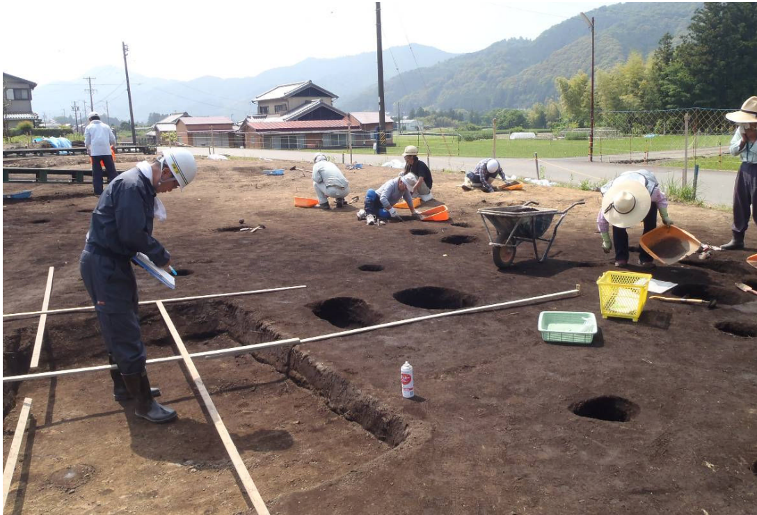
調査地の様子（東から）