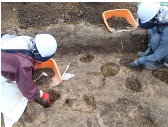
柱跡がいくつも見つかりました。