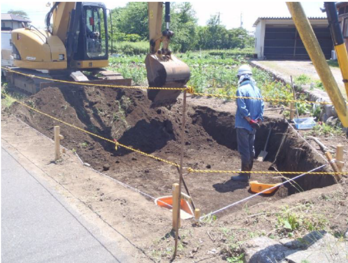
C区 表土掘削の様子（北東から）