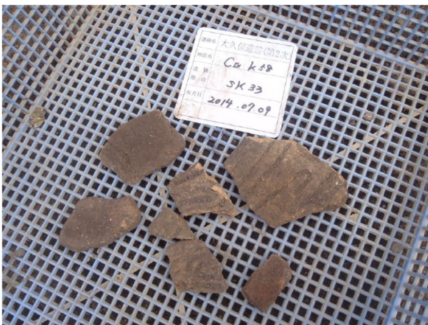
C区 土坑から出土した縄文土器片

C区は、国道306号線に接した細長い調査区です。遺構掘削を始めてさっそく縄文土器片が土坑から出土しました（左写真）。今後の発掘情報に御期待下さい。