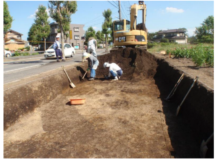
C区 表土掘削の様子（北から）