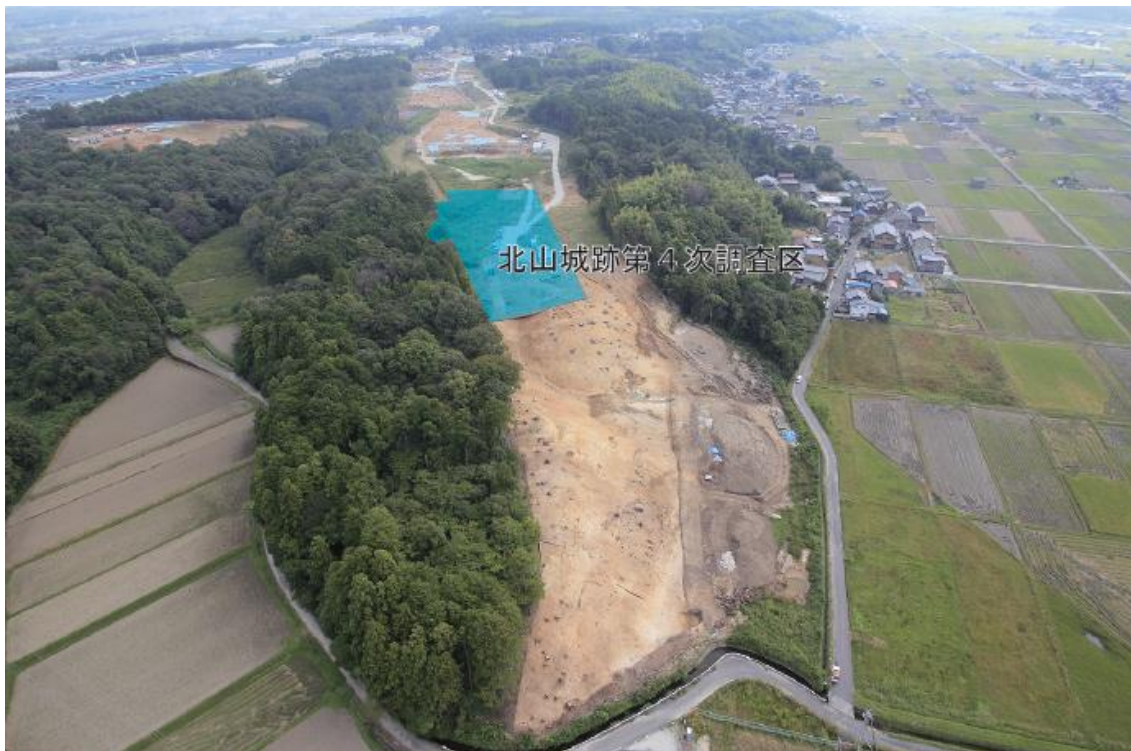
上空からみた北山城跡（写真は第3次調査時のもので、水色が第4次調査区）

コメント : これまでの調査では弥生時代～古墳時代（今から1,800～1,700年前頃）の竪穴住居を中心とした集落跡が確認され、多数の弥生土器や土師器が出土しています。今回は、こうした集落跡の中心部分を調査するため、これまで以上の成果が期待できます。また遺跡の名前にもあります、北山城そのものに関わる戦国期の遺構や遺物の発見も期待できます。