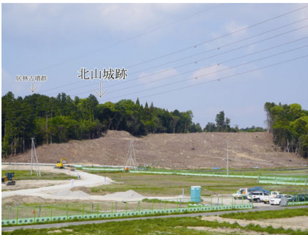
調査区南からの写真

丘陵上面は中野山遺跡でも確認された集落の跡が、北山城跡の範囲にまで広がると予想されます。縄文時代や弥生時代、古墳時代の遺構・遺物の確認も期待できます。また北山城跡の西側には居林古墳群が所在しており、斜面部の調査では北山城関連のもの他に、古墳時代のものも確認できるかもしれません。城跡に集落、古墳と、今後の調査が楽しみな遺跡です。