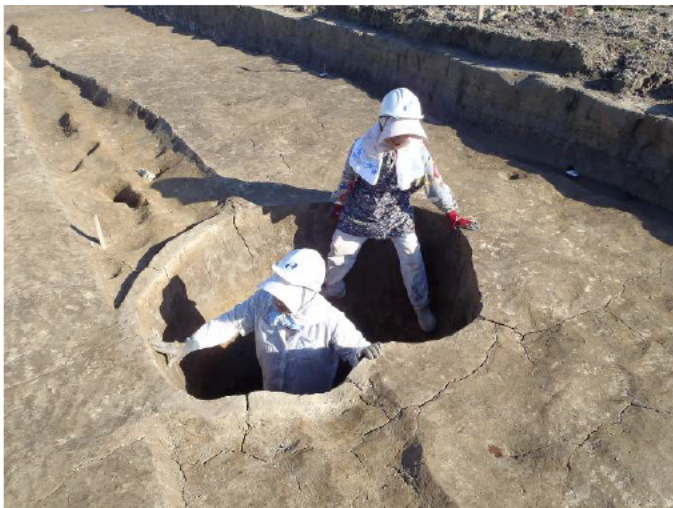
① 第7-7調査区：素掘りの井戸（鎌倉時代か）