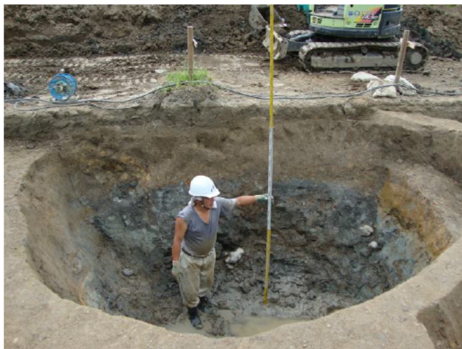
② 第7-5調査区：石組み？の井戸（鎌倉時代以降）